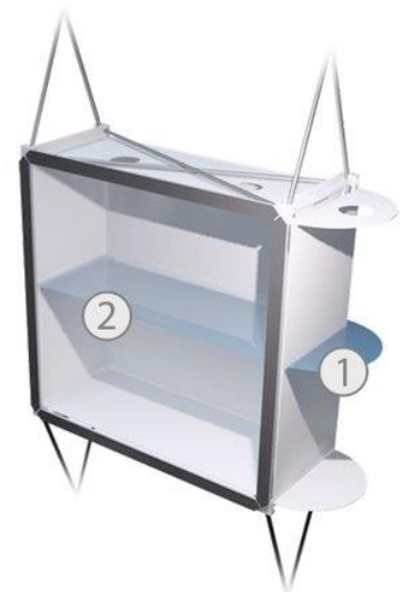
1. Боковая витрина 2. Центральная витрина

Производство наружной и интерьерной рекламы Производство динамической системы «Живая реклама» и поставка динамических панелей «SolaAir»