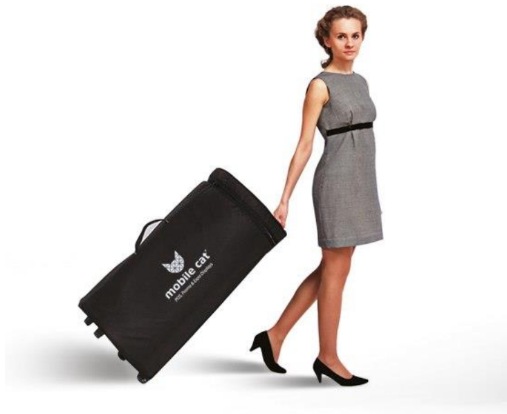
Нейлоновая усиленная сумка на колесиках