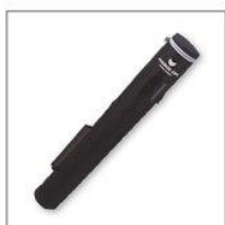
НЕЙЛОНОВАЯ СУМКА (ВНУТРИ КАРТОННАЯ ГИЛЬЗА)