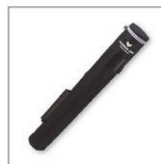
НЕЙЛОНОВАЯ СУМКА (ВНУТРИ КАРТОННАЯ ГИЛЬЗА)