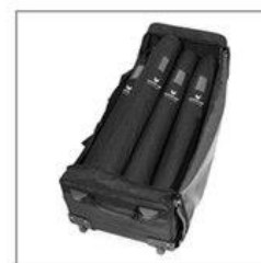
ЖЕСТКАЯ СУМКА НА КОЛЕСИКАХ. ВМЕЩАЕТСЯ ДО 9 СТЕНДОВ