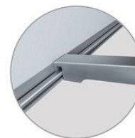
Алюминиевая лапка легко защелкивается в нижний профиль