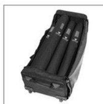
ЖЕСТКАЯ СУМКА НА КОЛЕСИКАХ. ВМЕЩАЕТСЯ ДО 9 СТЕНДОВ

Производство наружной и интерьерной рекламы Производство динамической системы «Живая реклама» и поставка динамических панелей «SolaAir»