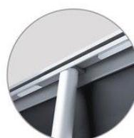
Надежное крепление штанги с верхним профилем