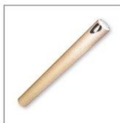
КАРТОННАЯ ГИЛЬЗА С РУЧКОЙ ДЛЯ ПЕРЕНОСКИ